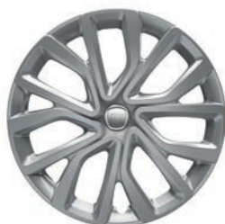
Felgi stalowe, półkotpak