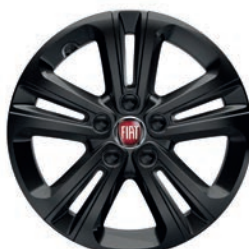
Felgi stalowe, kotpak